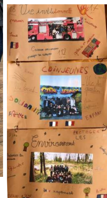
Photo lauréate du parcours citoyen 2022/2023

Jeudi 31 août de 13h à 19h, le Cube Garges accueillera la 10 e édition du Village éducatif. Parents, enfants et acteurs de l'éducation s'y retrouveront pour une journée dédiée à la réussite scolaire.