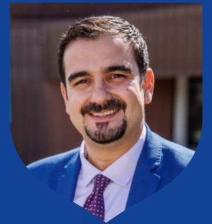
Benoît Jimenez Maire de Garges-lès-Gonesse

En cette rentrée 2023, je souhaite à chacun d'entre vous de trouver l'activité qui vous permettra de vous épanouir pleinement à Garges.