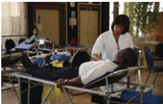
*Etablissement Français du Sang

Après le prélèvement, les trois principaux composants sanguins (globules rouges, plaquettes, plasma) sont séparés. Le don de plasma permet par exemple de soigner les grands brûlés ou de préparer des médicaments pour soigner les hémophiles. Le don de plaquettes permet de traiter les hémorragies chez les malades.