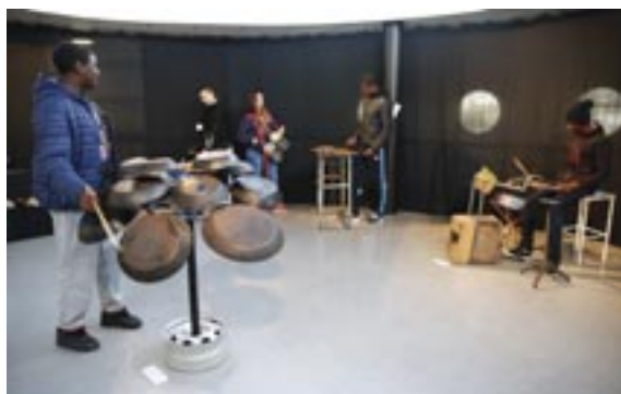
Un parcours ludique et musical à regarder, écouter et toucher à l'Espace Lino Ventura.