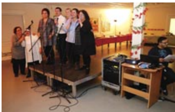
Au programme de la soirée, un repas placé sous le signe du partage suivi d'un karaoké au Centre Social du Plein Midi.