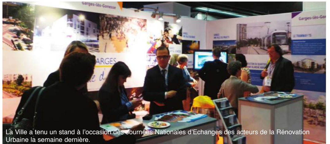
La Ville a tenu un stand à l'occasion des Journées Nationales d'Echanges des acteurs de la Rénovation Urbaine la semaine dernière.

Garges est réputée pour avoir mené avec succès le plus gros projet de rénovation urbaine à échelle communale. La municipalité va pouvoir lancer un nouveau programme de rénovation urbaine à Dame Blanche Nord.