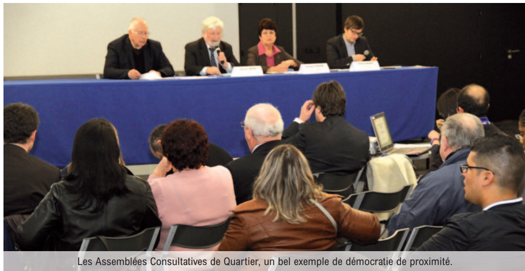
Les Assemblées Consultatives de Quartier, un bel exemple de démocratie de proximité.

Parce que la proximité permet l'écoute, le dialogue et la participation, le Maire et les élus viennent à vous pour répondre à vos préoccupations.