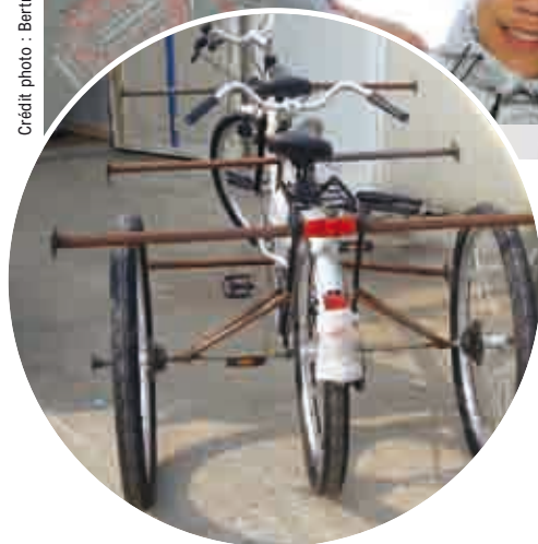
6 des participants